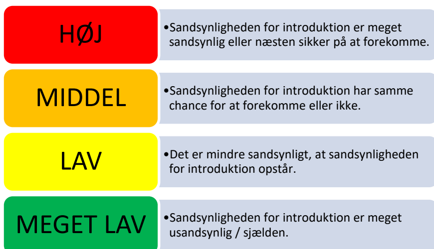
Figur 2 Risikoniveau terminologi anvendt i Trusselsvurdering