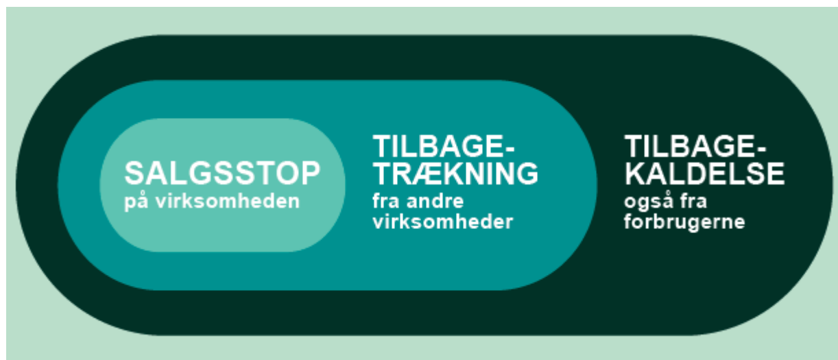
Grafik. Forskel på salgsstop, tilbagetrækning og tilbagekaldelse.

Skematisk oversigt over, hvornår virksomheden skal starte en tilbagetrækning eller en tilbagekaldelse.